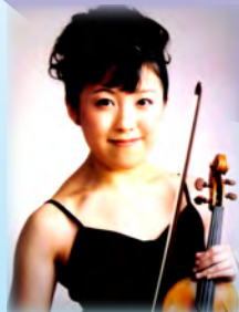
垣内美希 (ヴァイオリン)